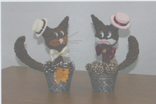
Средняя группа, Детский сад № 10 «Мур – Мяу»